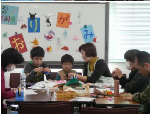
子どもたちの「工作遊びコーナー」 “ちぎり絵と双六”を通して交流

まつりの様子は、インターネットで JCN 日野ケーブルテレビのデイリーひの（ニュースコンテンツ http://hictstrm.hinocatv.ne.jp/ ）の2013年12月の欄で見ることができます。是非チェックしてみてください。