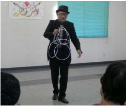
マジックショー不思議な世界を楽しんで！

※ 一般参加者が1割増、支援センター周辺住民の方々の参加が増え喜ばしい状況です。