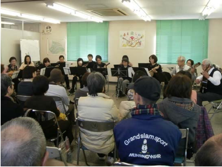
毎年恒例となっているマンドリン演奏。今年も大盛況！